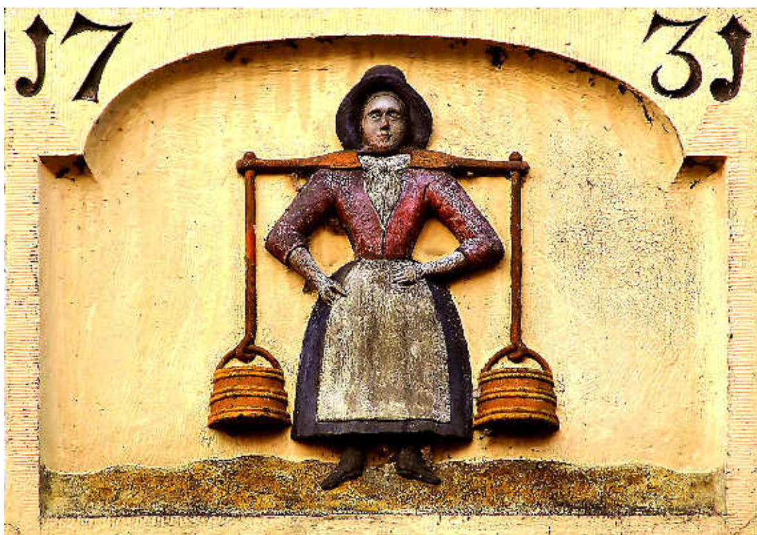
Gevelsteen met daarin een Waterlands melkmeisje afgebeeld.

Hij toont een gedetailleerde tekening van een melkschuit. „In Nieuwendam en Durgerdam waren scheepswerven. Daar werden ze gebouwd. De